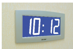
Opalys 14 montaje encastrado

El servidor NTP debe tener un periodo de emisión (Poll) inferior a 128 segundos.