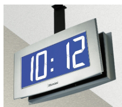
Opalys 14 en brazo para doble cara